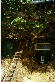
Bij een boerderij in het Zwanegat wordt het gedekt met stro.