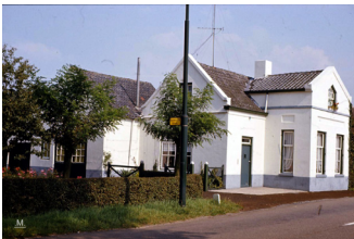
Het tolhuis. Zevenhuizen 1 Hier woonde Sjef de Win met 7 dochters, later woonde er Wim Rutten.