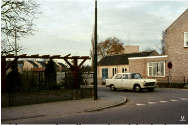
Giel Ras, in de volmond Gieleke, had een schoenwinkel en een eigen 'schoenmakerij'.