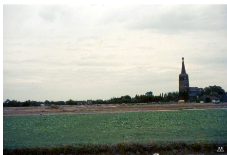
Zicht op de toren vanaf het terrein waar later de Kerkkackers zijn geko- men.