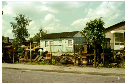
Links de kantoorafdeling. In het rechtergedeelte kwam later hobbyclub 't Prutske en het Repaircafé van Graaggedaan.