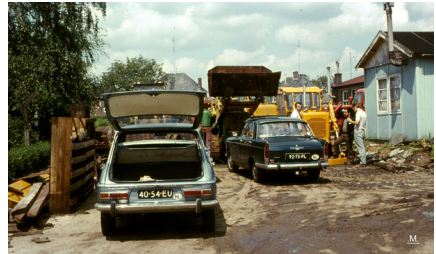
Het begin van firma Verhoeven, aan de Lindelaan.