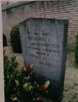
Gedenksteen op het graf van Th.J. van Laarhoven in Leende. Onderaan de tekst over turnvereniging 'Utile Dulci'.

een klant viel te bekennen. In de 'etalage' van zijn zaak lagen jarenlang onveranderlijk enkele opgetaste pakken Baas-boven-Baas -witkalk en rollen behang uitgestald. Kreeg hij van een klant ooit de opdracht om een ruit te vervangen, dan kostte hem dat meermalen een extra glasplaat voordat het karwei was geklaard. Het nemen van de maat, een benodigd stuk glas uit een groter geheel snijden, het vervoer, er mislukte dikwijls wat. Hij reed bijvoorbeeld met zijn fiets van huis naar de klant toe, met de nieuwe ruit achterop. Een kleine oneffenheid in de weg veroorzaakte dan barsten in het glas, zodat hij opnieuw moest beginnen. Zijn titel van meester-schilder maakte hij in onze ogen nooit waar. Later werd hij ook nog conciërge op de jongensschool, waar hij naast woonde. Kukerol kreeg het toen zwaar te verduren. De Leendse scholieren haalden het bloed onder zijn nagels vandaan, terwijl hij hand- en spandiensten verrichtte in en om het schoolgebouw. Hij kon helemaal niet met de jeugd omgaan of iets van de jeugd verdragen.