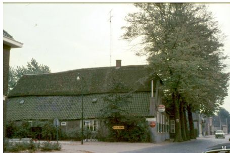
De Vier Linden. Dit is een rijksmonument met een historie die teruggaat tot 1684.